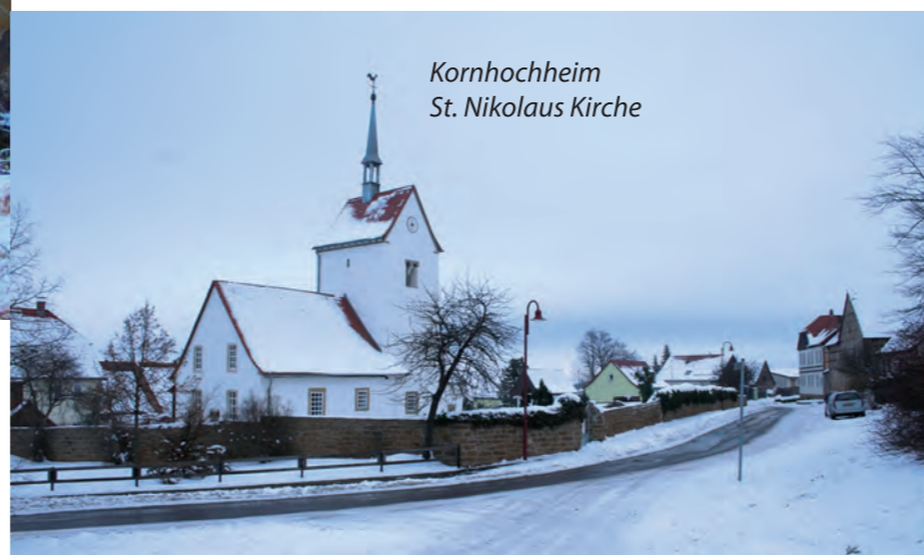
Kornhochheim St. Nikolaus Kirche

Wir haben den Vorteil im Städtedreieck Erfurt-Arnstadt-Gotha zu liegen mit dem direkten Anschluss an das erfolgreiche Gewerbegebiet "Erfurter Kreuz". Diese Chance gilt es zu nutzen, um die eigenen Gewerbegebiete weiter zu vermarkten. Wir sind für die Gründung eines Wirtschaftsstadtmittes, der die Möglichkeit bieten soll, den Dialog zwischen Gewerbe und Gemeinde zu vertiefen. Weiterhin wollen wir die Attraktivität für die Ansiedlung oder den Ausbau von Geschäften, Märkten, Handwerk oder Industrie in allen Ortschaften steigern (siehe unten). Wichtig ist uns auch, dass alle Interessenten die gleichen Chancen erhalten. Die Gemeinde hat einen Bauhof, der neu strukturiert werden muss, um die Bürgerzufriedenheit zu steigern. Dabei sollte auch geprüft werden, inwiefern es sich lohnt, Aufgabenbereiche an die freie Wirtschaft abzugeben.