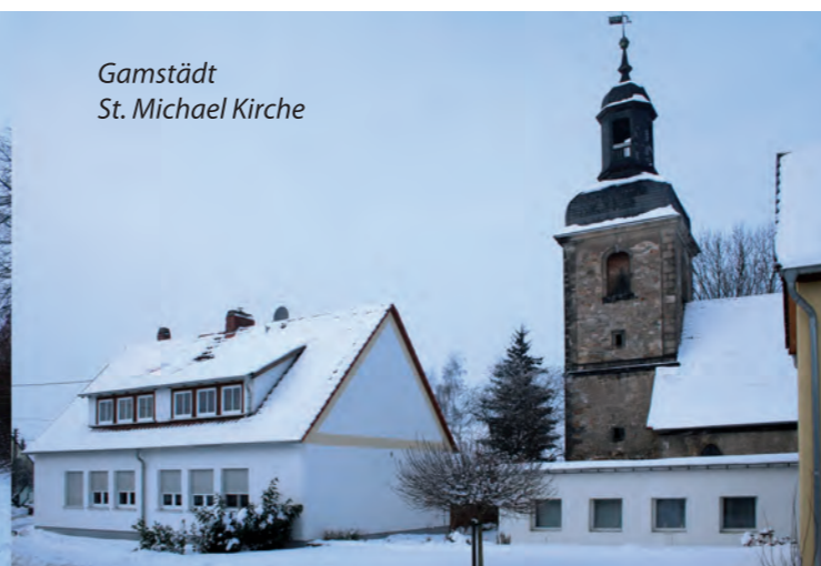
Gamstädt St. Michael Kirche