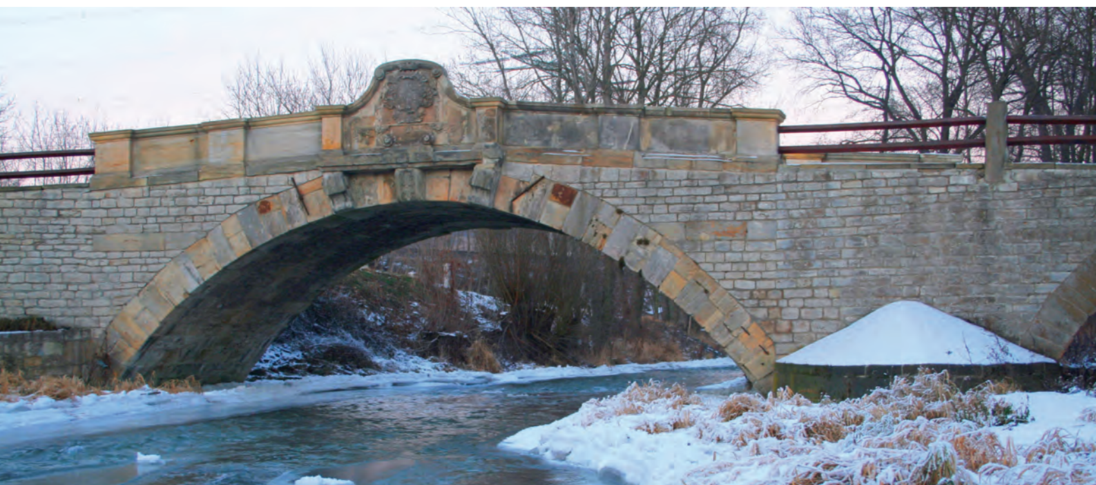
Brücke über die Apfelstädt bei Ingersleben