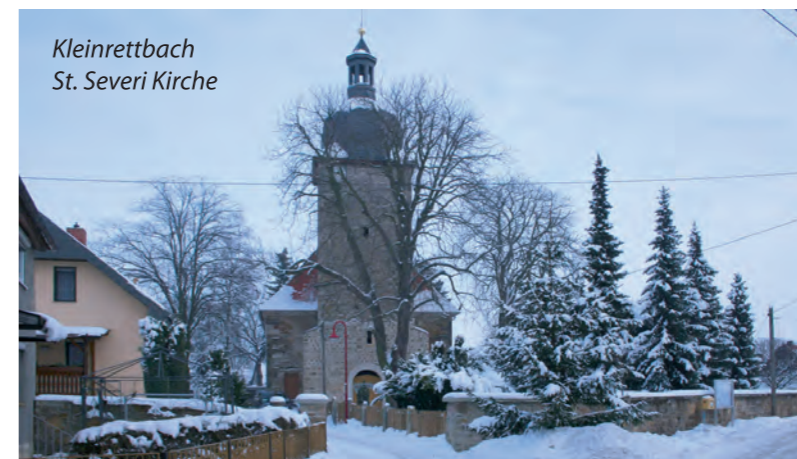
Kleinrettbach St. Severi Kirche

Zur Verbesserung der Bürgerzufriedenheit, um den Informationszugang zu erleichtern und um die Gemeinde nach innen und außen in ihrer gesamten Vielfalt darzustellen, ist eine Internetpräsenz erforderlich, in der sich alle Orte wiederfinden.